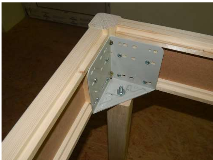
Smontovaný roh rámu kolejiště