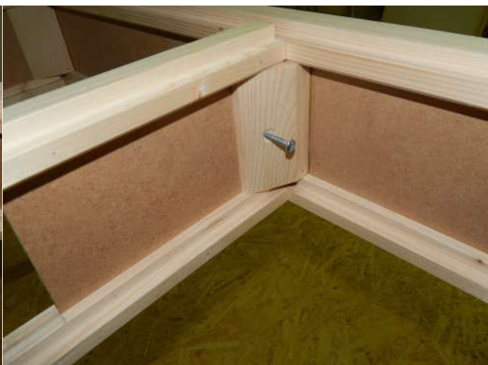
Montáž výztuhy do čela rámu kolejiště